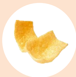
Сметаны с луком